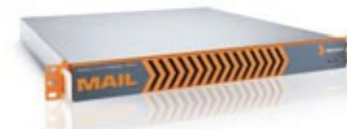
Astaro Mail Gateway 4000