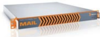
Astaro Mail Gateway 2000