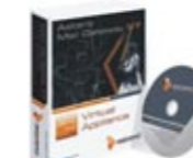
AMG Virtual Appliance